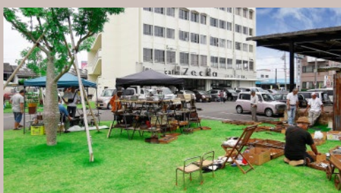
青空市やマルシェなどにも好評