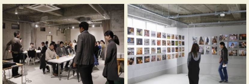
各種イベントや展示会などに